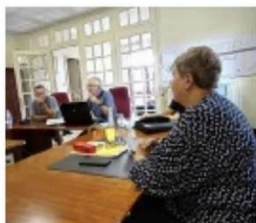
Cette nouvelle association a pour but d'organiser les commémorations patriotiques.