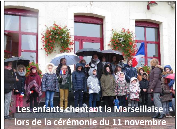
Les enfants chantant la Marseillaise lors de la cérémonie du 11 novembre